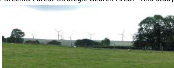
Photomontage of Blaengwen, taken from Brynawel Farm. Distance to nearest turbine is 2.9 km.

Force 9 Energy has received planning permission from Carmarthenshire County Council for its 10-turbine wind farm near Alltwalis and Pencader. This is the first planning application to be approved in Strategic Search Area G and puts Force 9 Energy at the forefront of wind farm development in this area which is encouraged by planning policy and supported by TAN8. The wind farm will have a maximum installed capacity of 30 MW. The original application for the wind farm had been with the Council since January 2005. The application was approved by the planning committee in August 2005 but surprisingly overturned by the Council's now disbanded Departures Committee pending the results of a study by Ove Arup to refine the Brechfa Forest Strategic Search Area. This study subsequently confirmed the Blaengwen site as being suitable technically and from a landscape and visual point of view and capable of making a significant contribution to the achievement of the Brechfa Forest capacity target of 90 MW by 2010. Work on the project is likely to start in the next 6 to 12 months with construction scheduled to be completed in 2008.