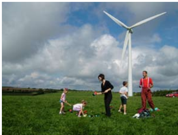
Mharc Cynog Fferm Wynt

Y mae Diwrnodau Agored, er mwyn caniatáu i'r gymuned leol gael cyfle prin i fynd yn agos at y tyrbînau, wedi denu mwy na 250 o ymwelwyr ac y maent wedi cynorthwyo i feithrin yr ysbryd o gymdogrwydd da.