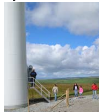
Wind Weekend visitors to Hafoty Ucha taking a turbine tour. More at www.embracewind.com

An event over the August Bank Holiday – Wind Weekend – allowed visitors to experience the power of the wind, when flagship wind farms opened their gates to members of the public, giving people the opportunity to see wind energy in action. Rheidol Wind Farm, near Aberystwyth in Ceredigion and Hafoty Ucha Wind Farm near Corwen in Conwy offered free entertainment for all the family, from wind turbine tours, interactive activities and energy efficiency advice, and long time renewables exponents, the Centre for Alternative Technology in Machynlleth in Powys, also opened over the weekend.